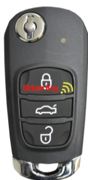
J5 / J5V