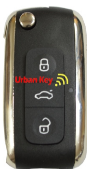
J7 / J7V