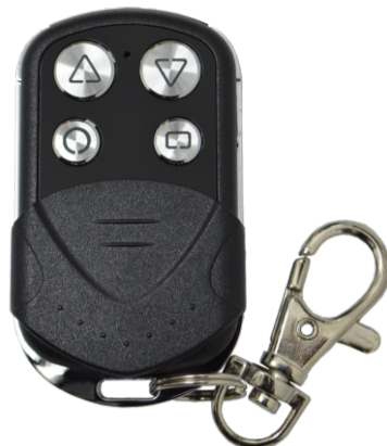
L11 / A3