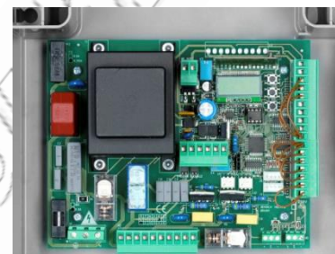
BRAINY / HEADY